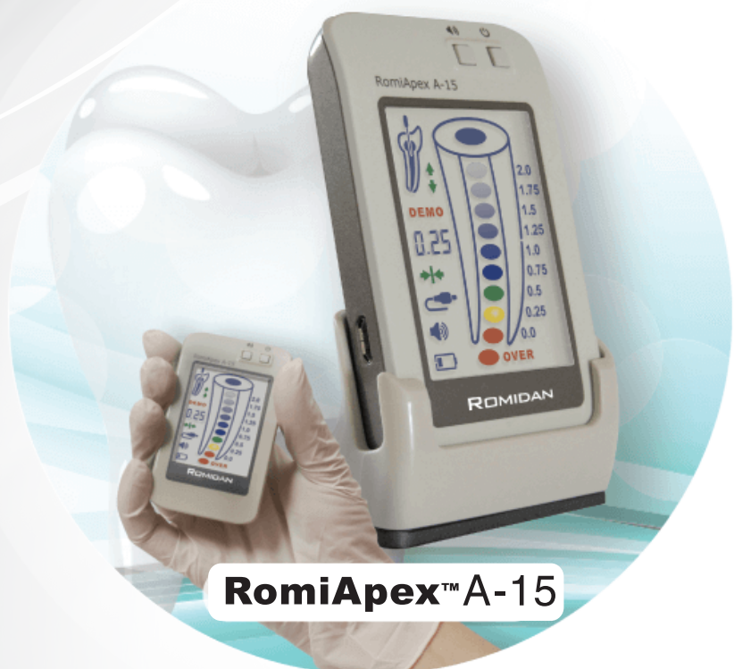
RomiApex TM A-15

Giấy chứng nhận chất lượng theo tiêu chuẩn Châu Âu